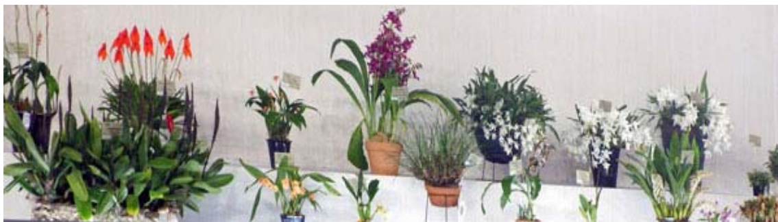
世界らん展 2020 東京ドームで観てきました (2/14~2/21)

・生涯現役時代を迎え高齢者の就業率は年々高まっています。29/1/1以降に65歳以上の人、を雇用した場合だけでなく、28/12/31までに雇用した65歳以上の人についても、週所定労働時間が20時間以上であり31日以上雇用する見込みであれば原則適用の対象となり保険料を徴収することになります。