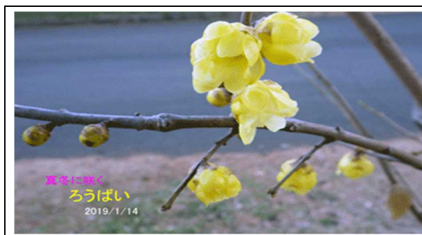
真冬に咲くろうばい

連休前の前倒しには作業準備期間の問題もあり、通常の年でさえこの期間に集中する決算発表が5/7から5/15までの短期間に集中することが予想され、企業は会場の手配など始めているようである。