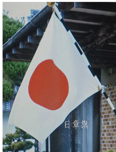
赤と白の美しいシンプルなデザイン