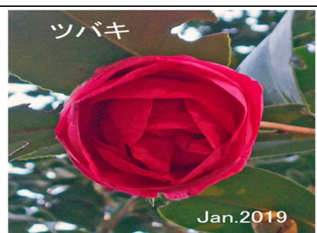
1月に咲いていたツバキ

■ 銀行などの 金融機関 にとってもデータ保管、システムへの対応、夜間金庫などの物理的対応その他多くの対策課題を抱えているようである。