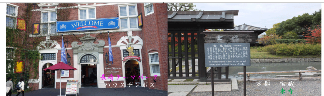
趣味に保養に明日への活力を・・・長崎・ハウステンボス

5 第1項又は第2項の年次有給休暇が10日以上与えられた従業員に対しては、第3項の規定にかかわらず、付与日から1年以内に、当該従業員の有する年次有給休暇日数のうち5日について、会社が従業員の意見を聴取し、その意見を尊重した上で、予め時季を指定して取得させる。但し、従業員が第3項又は第4項の規定による年次有給休暇を取得した場合においては、当該取得した日数分を5日から控除するものとする。