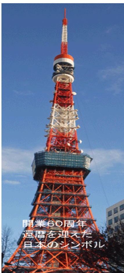
東京タワー 60th Anniversary