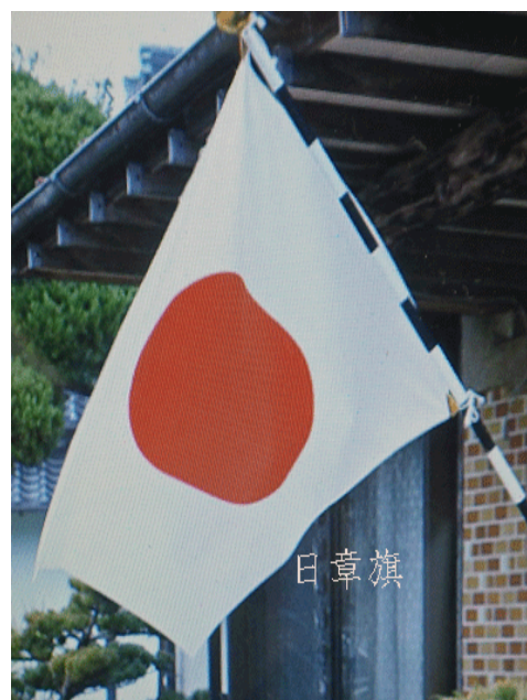
赤と白の美しいシンプルなデザイン